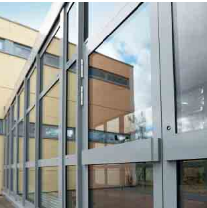
Schüco Aluminium Tür-System ADS 50.NI Schüco Aluminium door system ADS 50.NI

Aluminium Tür-System Aluminium door system